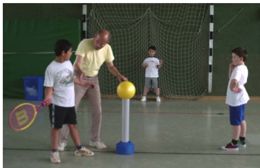
Das Dreieck-Spiel - Schläger, Fänger, Positionierer

Besonders der erste Fänger kann seine Standposition zum Fangen des Balles frühzeitig nach den Merkmalen der Schlagausführung ausrichten. Durch die unterschiedliche Schlägerhaltung (Schlagwinkel), Standposition des Schlägers und Schlagrichtung kommt es zu einer Antizipationsschulung für die Orientierung „flach-hoch“ und „links-rechts“.