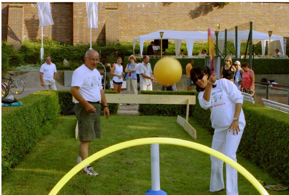
Bild oben: Rita Henke - Ausschussvorsitzende für Familie, Jugend und Sport des sächsischen Landtages - beim Erlernen des Top-Spin-Schlages mit dem „Top-Pin“.

Bild unten: Anfängerunterricht innerhalb des Lingener Schulsport-Projektes „ISI“ (Integrieren statt Isolieren)