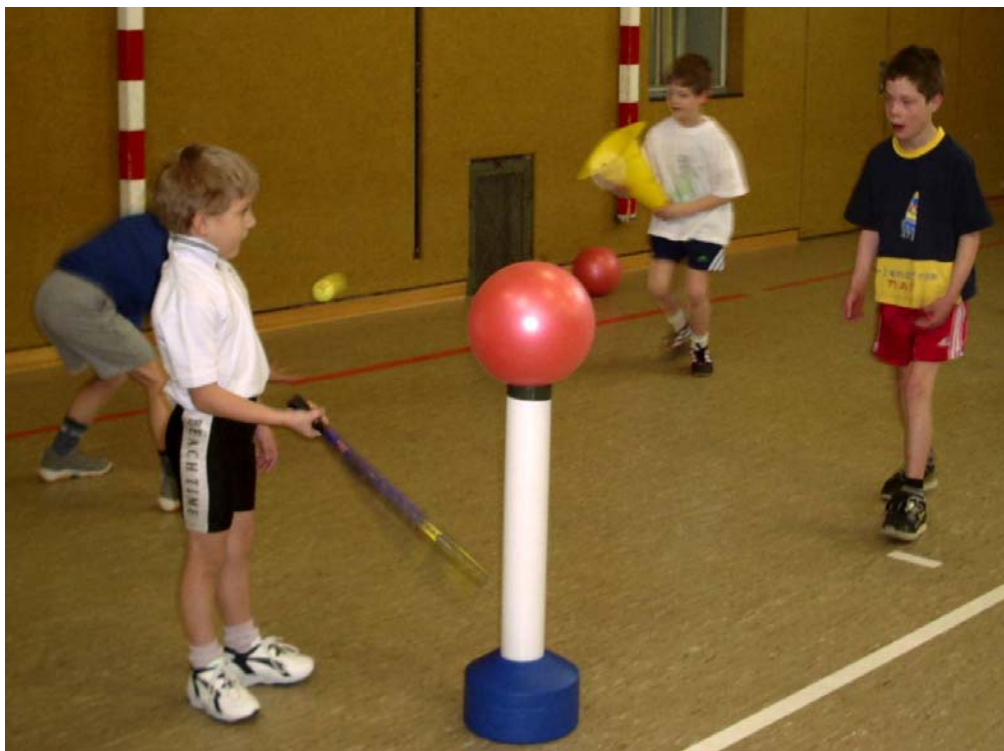
Bild unten: Anfängerunterricht innerhalb des Lingener Schulsport-Projektes „ISI“ (Integrieren statt Isolieren)

Bild oben: Rita Henke - Ausschussvorsitzende für Familie, Jugend und Sport des sächsischen Landtages - beim Erlernen des Top-Spin-Schlages mit dem „Top-Pin“.